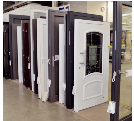
/ Ob klassische oder moderne Eingangstüren: Nach der Qualitätskontrolle werden sie sicher eingepackt.

die Rahmenbefestigungen lassen sämtliche Montageverschraubungen unsichtbar werden. Auch die lediglich 12 mm hohe Anschlagbodenschwelle (flach ohne Hügel) hat einen verdeckten Schraubkanal. Im Bodenbereich befinden sich eine Bürsten-, Schleif- und eine Anschlagdichtung. Das sorgt für hohen Schlagregenschutz und eine Luftdichtheitsklasse von 4A. Das Dichtungsaufnahmeprofil im Türblatt kann durch Justieren problemlos Bodenunebenheiten ausgleichen. Das Dornmaß beträgt komfortable 65 mm. Ein hoher Einbruchschutz wird durch die Widerstandsklasse RC2 gewährleistet. Die Türen sind mit Sicherheits- und Beschlagelementen ausgestattet. Beispiele dafür sind eine Kontaktbrücke, die für Strom im Flügel sorgt, ein Motorschloss oder der Fingerscanner mit von Graute selbst entwickelter Blende (produziert vom Beschlagspezialisten Fuhr). Die Stangengriffe kommen entweder von FSB oder von anderen Herstellern. Was die Bandtechnik angeht, kommt wieder die Selbstentwicklung ins Spiel. Sowohl bei den Haustüren Therm-90 und Therm-105 sowie bei Wohnungsabschlusstüren setzt Graute