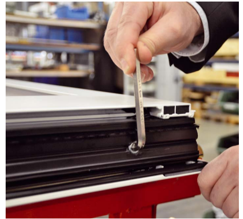
/ Mit einem Inbus kann das Dichtungsprofil justiert werden, um Bodenunebenheiten auszugleichen.