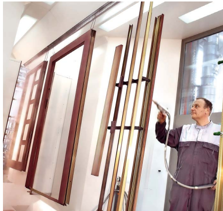
/ Bevor die Teile in die Pulverbeschichtungsanlage fahren, werden die kritischen Stellen vorbeschichtet.