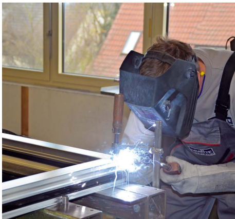
/ Die Ecken sowie auch alle Sprossen der Haustüren werden bei Graute aufwendig verschweißt.