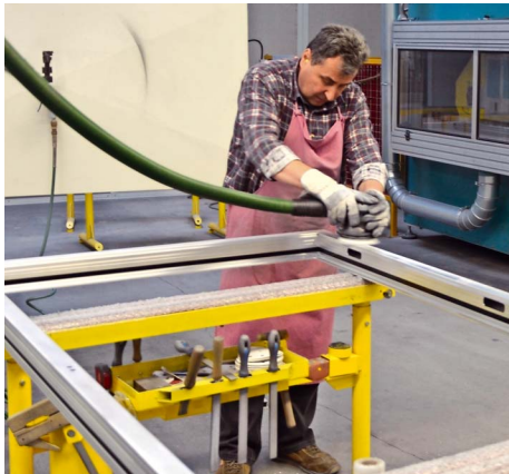
/ Nach dem Verschweißen werden die Ecken von Hand geschliffen und entgratet.